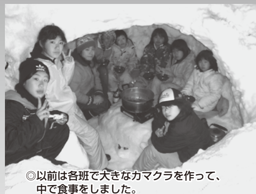
◎以前は各班で大きなカマクラを作って、中で食事をしました。